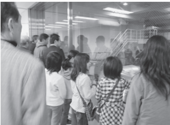
森本・坊岡区民 岡山市東部クリーンセンター見学 (H21.3.26)