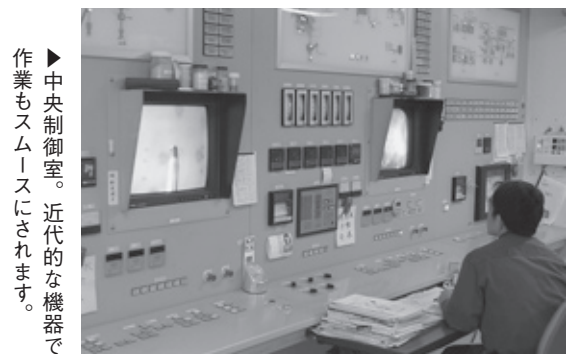
▶中央制御室。近代的な機器で作業もスムーズにされます。

下がることの繰り返しで毎日運転を行っています。激しい温度変化と燃焼時の高温負荷により炉内耐火物の消耗が激しく、毎年度の施設修繕に要する費用も年々増加しています。