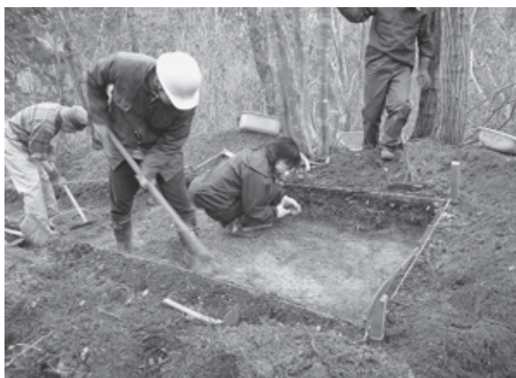
埋蔵文化財試堀調査 (H21.3.23)